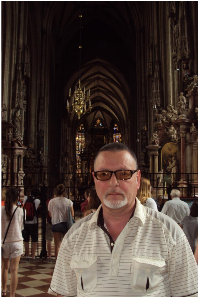
2011. La Viena