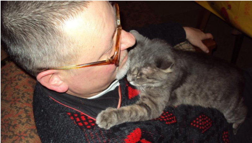
2009. În momentele de relaxare