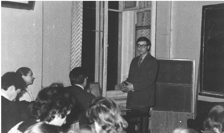
1972. Conservatorul din Moscova, participant la conferință