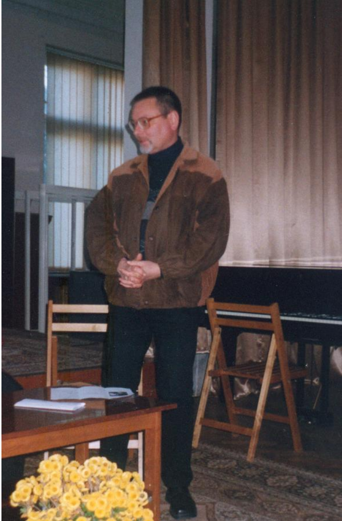
2002. La Biblioteca Națională, Salonul Muzical