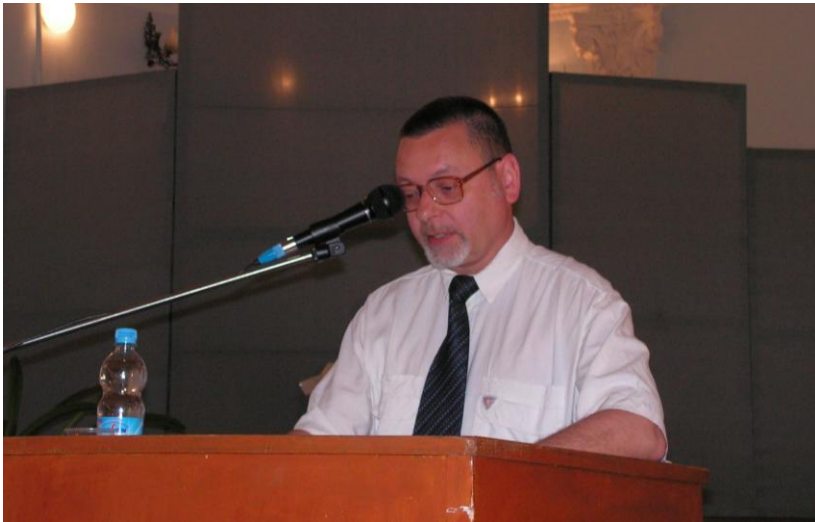
2005. La conferința republicană Cultura Moldovei între totalitarism și democrație