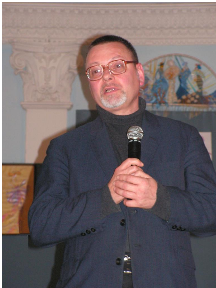
2007. La Academia de Muzică, Teatru și Arte Plastice